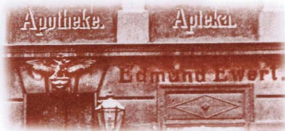
Ryc. 3. Apteka „Pod Orłem” w Mosinie (1906)