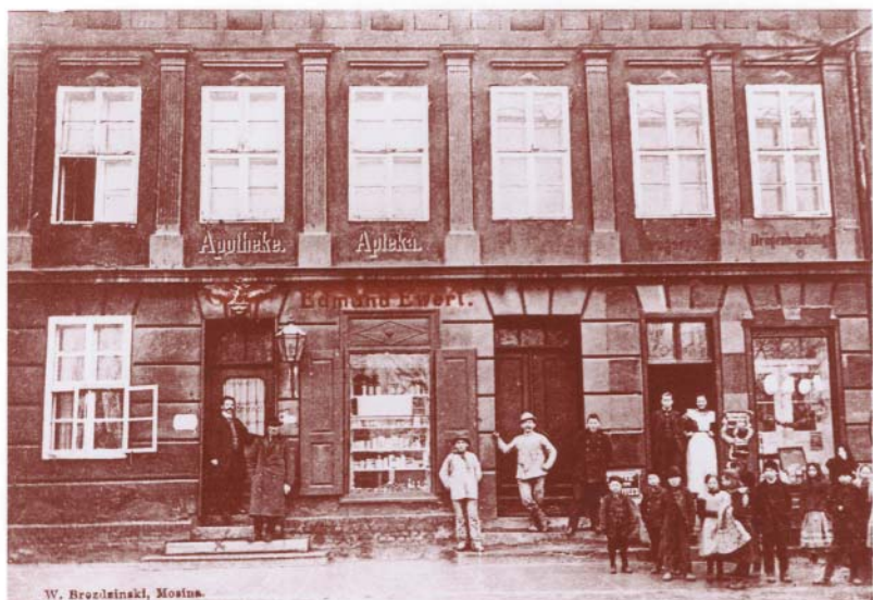
Edmunda Ewerta Apteka pod Orłem Drogeria i chemiczne laboratorium